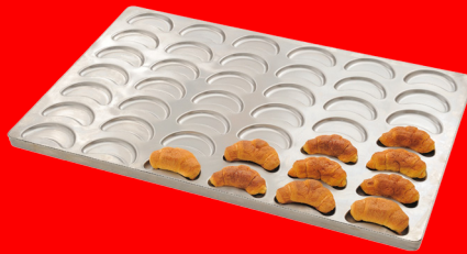
Teglia per croissant su piastra unica in alluminio o lamiera alluminata