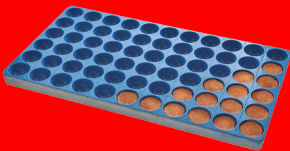
Forma semisferica con teflon ad alta antiaderenza