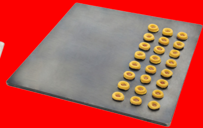
Teglia piana in lamiera per impianti ad alta produttività