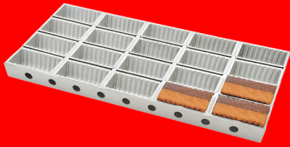
Telaio per cake con bacinelle stampate a profilo rigato