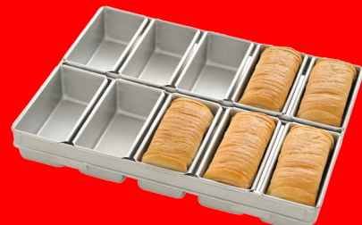
Telaio impilabile per panbauletto