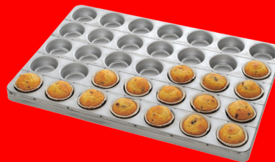
Teglia per muffin con ampia scelta di sagoma e diametro