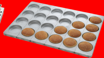
Teglia per hamburger maxi diametro 125mm